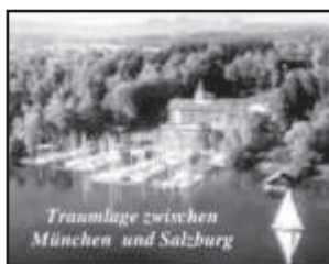
Traumlage zwischen München und Salzburg

97440 Werneck-Zeuzleben, Freistück 2 Tel. 0 97 22 / 94 56-0 • Fax 0 97 22 / 94 56-20